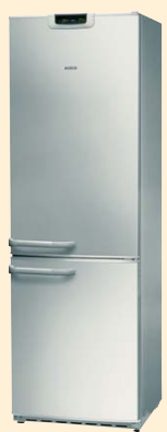
KGP 36360 сереб. мет.

ANTI BACTERIA 60 CM Класс энергопотребления А