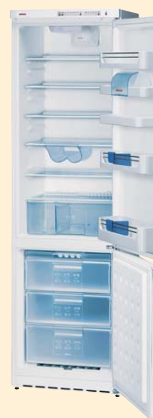
KGS 39310 белый

ANTI BACTERIA 60 CM Класс энергопотребления А