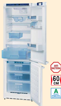
KGP 36320 белый

ANTI BACTERIA 60 CM Класс энергопотребления А