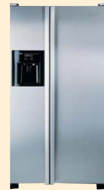
KGU 66990 нерж. сталь