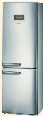
KGM 39390 нерж. сталь