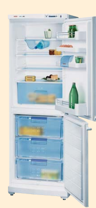
KGV 31422 белый

ANTI BACTERIA 60 CM Класс энергопотребления А