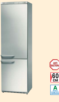
KGS 39360 сереб. мет.

ANTI BACTERIA 60 CM Класс энергопотребления А