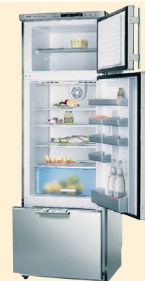
KDF 324A2 нерж. сталь