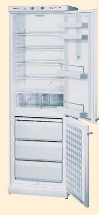
KGS 37340 белый

ANTI BACTERIA 60 CM Класс энергопотребления В