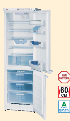
KGS 36310 белый

ANTI BACTERIA 60 CM Класс энергопотребления А