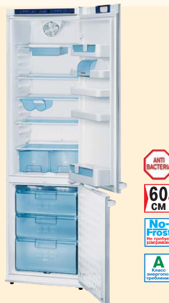
KGU 36122 белый

ANTI BACTERIA 60 CM Класс энергопотребления А