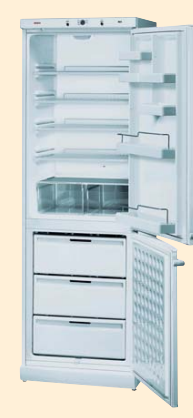
KGV 36300 SD белый

ANTI BACTERIA 60 CM Класс энергопотребления В