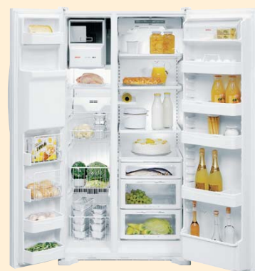
KGU 6920 белый