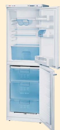
KGV 32421 белый

ANTI BACTERIA 60 CM Класс энергопотребления А