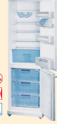
KGV 35422 белый

ANTI BACTERIA 60 CM Класс энергопотребления А